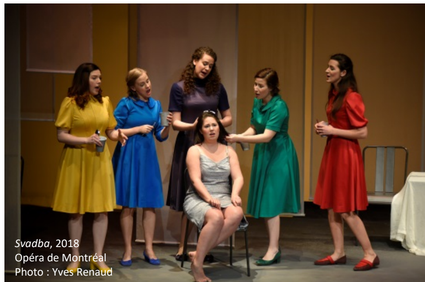
Svadba , 2018 Opéra de Montréal

Les 25 personnes-ressources et les répondants ont été informés que le sondage devait être effectué par des membres du conseil d'administration et des employés permanents, contractuels ou saisonniers travaillant à temps plein ou à temps partiel dans les secteurs suivants : administration, art et technique. Le sondage n'a pas été envoyé à des personnes engagées pour une seule prestation ni à des bénévoles autres que des membres de conseils d'administration.