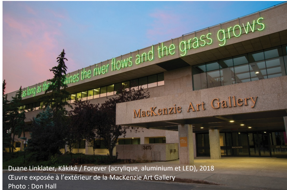
Duane Linklater, Kâkikê / Forever (acrylique, aluminium et LED), 2018 Œuvre exposée à l'extérieur de la MacKenzie Art Gallery

Dans certains cas, plus d'une réponse s'applique à la situation d'un répondant. Les questions à réponses multiples permettent aux répondants de choisir plus d'une catégorie de réponse pour une question. Pour les questions qui demandent des réponses multiples (p. ex. « Veuillez sélectionner la ou les langues que vous parlez et comprenez.